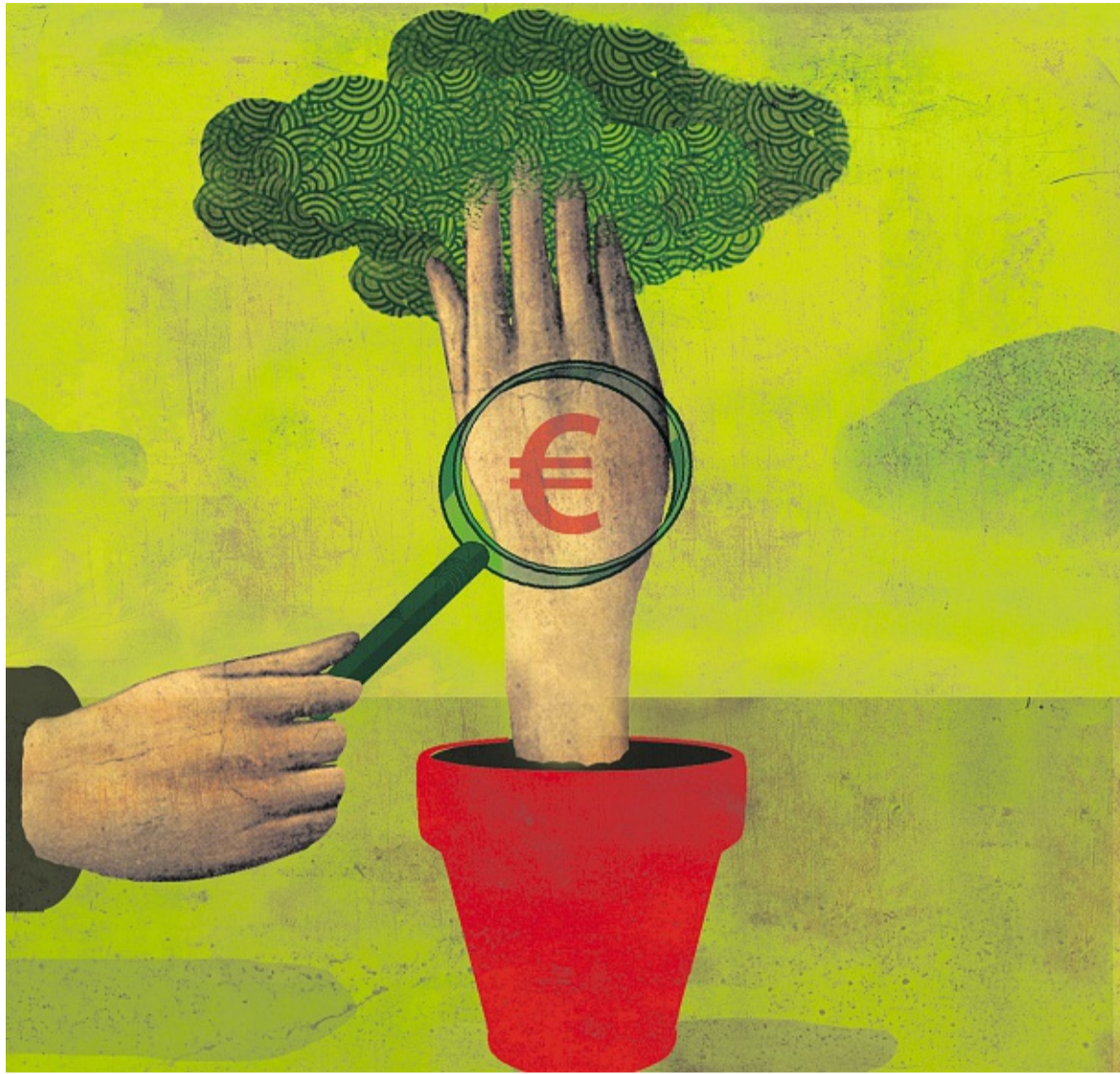
ILLUSTRATION OLIVIER MARBEUF