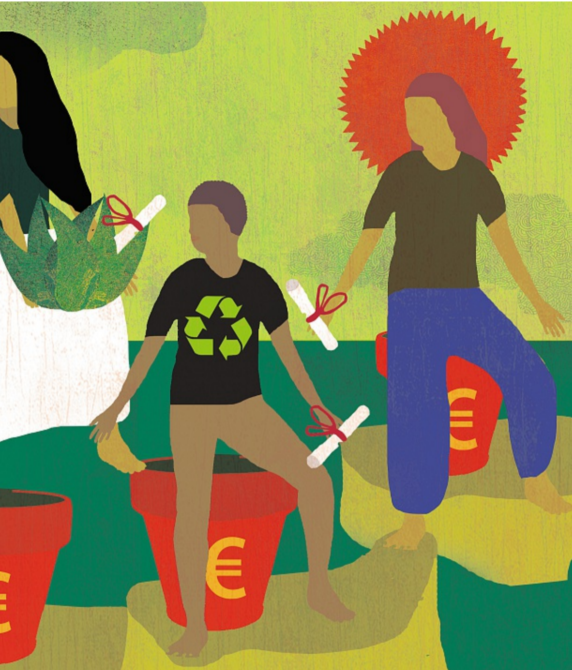
ILLUSTRATION OLIVIER MARBEUF