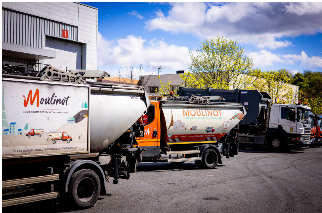
Camions de collecte de l'entreprise Moulinot, à Stains (Seine-Saint-Denis), en mars.