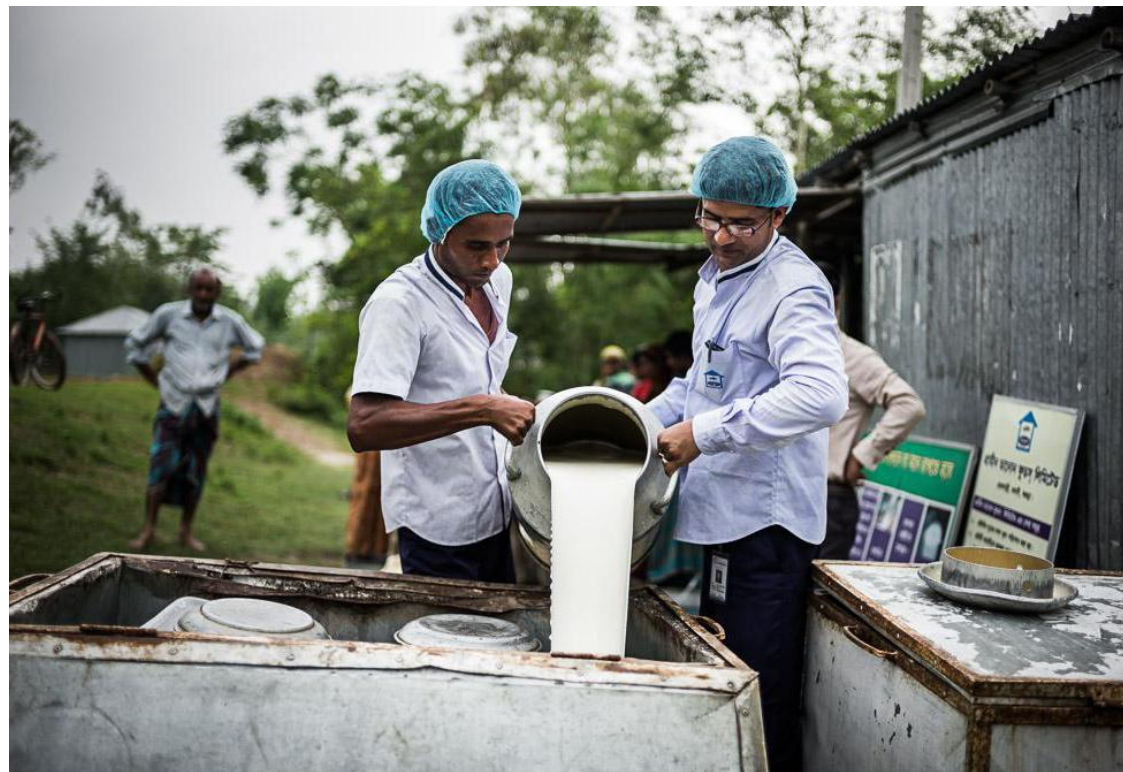
L'usine de la Grameen Danone Foods produit des yaourts enrichis en micronutriments à des prix abordables, à Bogra (Bangladesh), depuis 2006.

C'est ce que fait la Grameen Danone Foods à Bogra, au Bangladesh, depuis 2006. Ce partenariat entre la banque que j'ai fondée, la Grameen et le groupe Danone a permis de créer une usine produisant des yaourts enrichis en micronutriments à des prix abordables. Ni Grameen ni Danone n'a retiré de bénéfices de l'opération, mais cela a permis d'améliorer l'alimentation